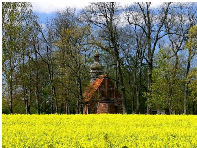
Widok na kościół

Kościół św. Izydora obecnie należy do parafii Trójcy Przenajświętszej w Kretominiu. Z dwuspadowego dachu wyrasta barokowa wieżyczka na sygnaturkę. Do wzniesienia ścian, oprócz cegły, gotyccy murarze użyli sporych rozmiarów kamieni. Wnętrze posiada wyodrębnione wieloboczne prezbiterium, a ściany boczne posiadają ostrołukowe i półkoliste otwory okienne. Kapitałny remont świątyni przeprowadzono w 1907r., z inicjatywy ówczesnego prezydenta regencji koszalińskiej von Sendena; po II wojnie światowej przejściowo – do 1979r. zamieniony na klubokawiarnię. Obiekt jest wpisany do rejestru zabytków