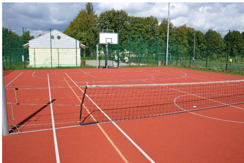
Kompleks boisk ORLIK 2012

Na terenie miejscowości dość dobrze rozwinięta jest baza sportowa. Przy Szkole Podstawowej znajduje się kompleks boisk ORLIK 2012 oraz siłownia zewnętrzna. Mieszkańcy miejscowości mogą również korzystać z boiska do piłki nożnej klubu sportowego „GROT”. Obecnie obiekt jest w trakcie prac renowacyjnych.