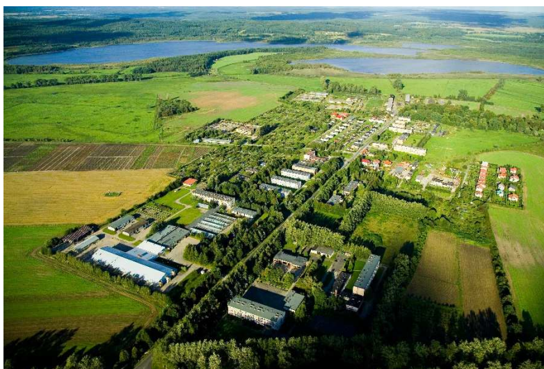
Widok na Bonin i Jezioro Lubiatowskie

Obszar gminy przedstawia krajobraz leśno – rolny o cechach harmonijnych. Lasy zajmują 66%, a rolnicza przestrzeń produkcyjna 23% powierzchni. Lasy o zróżnicowanych siedliskach i drzewostanach z sosną jako gatunkiem dominującym oraz użytki rolne o średniej i małej żyzności stanowią podstawowe naturalne bogactwo gminy.