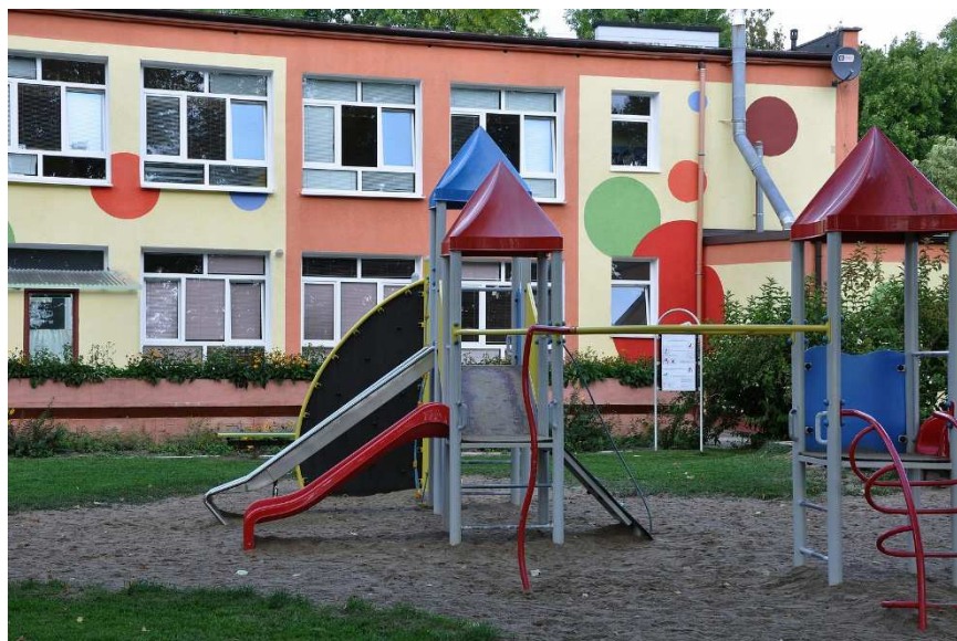
Przedszkole Gminne w Boninie

Zespół Szkół Rolniczych im. Wincentego Witosa to zarówno szkoła dla młodzieży jak i dorosłych. W ramach szkoły dla młodzieży działa technikum oraz zasadnicza szkoła zawodowa. Ucząca się tam młodzież może uzyskać tytuł technika weterynarii, technika architektury krajobrazu, technika żywienia i usług gastronomicznych, technika mechanizacji rolnictwa. W ramach szkoły zawodowej młodzież może kształcić się na: mechanika operatora pojazdów i maszyn rolniczych, rolnika, ogrodnika i kucharza małej gastronomii. Dla dorosłych dostępne kwalifikacyjne kursy zawodowe: technik rolnik, technik architektury krajobrazu, technik żywienia i usług gastronomicznych, technik mechanizacji rolnictwa, technik turystyki wiejskiej, technik agrobiznesu, technik ogrodnik, kucharz, mechanik – operator, rolnik i ogrodnik.