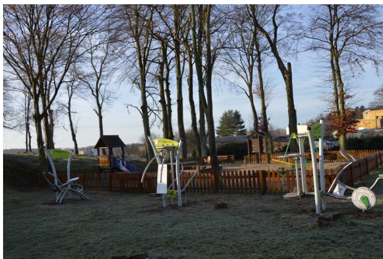
Siłownia zewnętrzna i plac zabaw

W chwili obecnej do inwestycji, które w pierwszej kolejności wymagają realizacji jest wykonanie nowych odcinków sieci wodociągowej, gdyż część mieszkańców korzysta z własnych studni, w których jakość wody nie jest najlepsza. Część sieci wymaga wymiany ze względu na brak szczelności. W miejscowości brak jest systemu odprowadzania ścieków. Mieszkańcy korzystają z szamb, które często są nieszczelne. Dodatkowo należy rozważyć ewentualną gazyfikację miejscowości w celu poprawy dynamiki rozwoju tego terenu jak również zmianę operatora sieci internetowej poprzez doprowadzenie światłowodu. Planami na przyszłość należy również objąć remont drogi z Wyszecborza do Policka a także możliwość odtworzenia połączenia drogowego pomiędzy Wyszecborzem a Lubiatowem jako alternatywę połączenia drogowego z miastem Koszalin w znacznym stopniu mającą wpływ na rozwój społeczno - gospodarczy całego sołectwa.